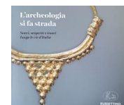
Anas, protocollo con Mibact per la valorizzazione delle scoperte archeologiche