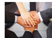
Unioncamere, la ripresa c'è siamo pronti a sostenere le imprese