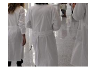
Salvare la sanità pubblica, la ricetta degli esperti