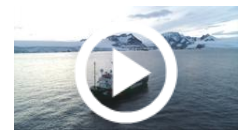
L'Antartide come non l'avete mai visto