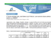
Energia, è online nuovo numero newsletter Gme